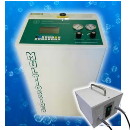
Fig. 1 - MEDICAL 95 CPS, Apparecchiatura per Ossigeno Ozono Terapia. Certificata 93/42/CEE Classe 2A